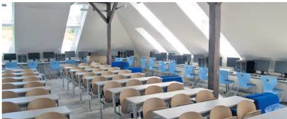
Půdní vestavba na ZŠ 28. října byla také podpořena evropskými penězi.

Podpora vzdělávání na Příbramsku probíhá mimo jiné díky tzv. Místnímu akčnímu plánu vzdělávání II. Aktuálně je vybráno více než 250 projektů ve školách na Příbramsku, jež by mohly získat finanční podporu ve výši až miliardy korun.