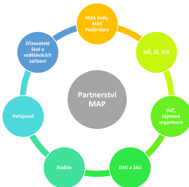
Obrázek 2 Organizace partnerství v pracovních skupinách

V průběhu realizace projektu může docházet na základě průběžného vyhodnocování řízení projektu k dílčím aktualizacím organizační struktury.